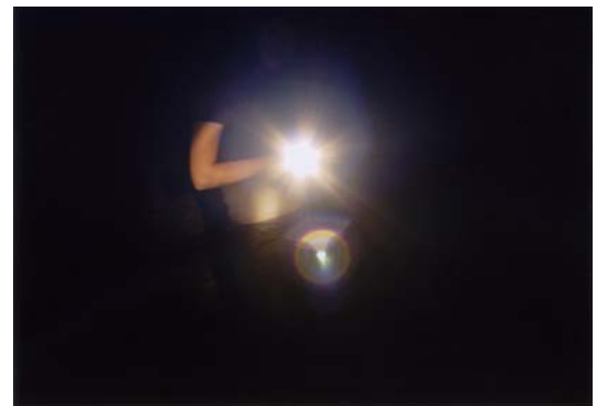
石川卓磨 | They Live #1 | 2007 | C-print | 406 x 508 mm