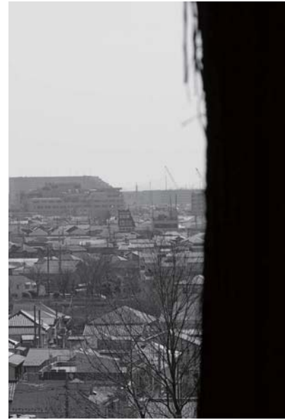
石川卓磨 | Filming Location: Invasion of the Body Snatchers | 2013