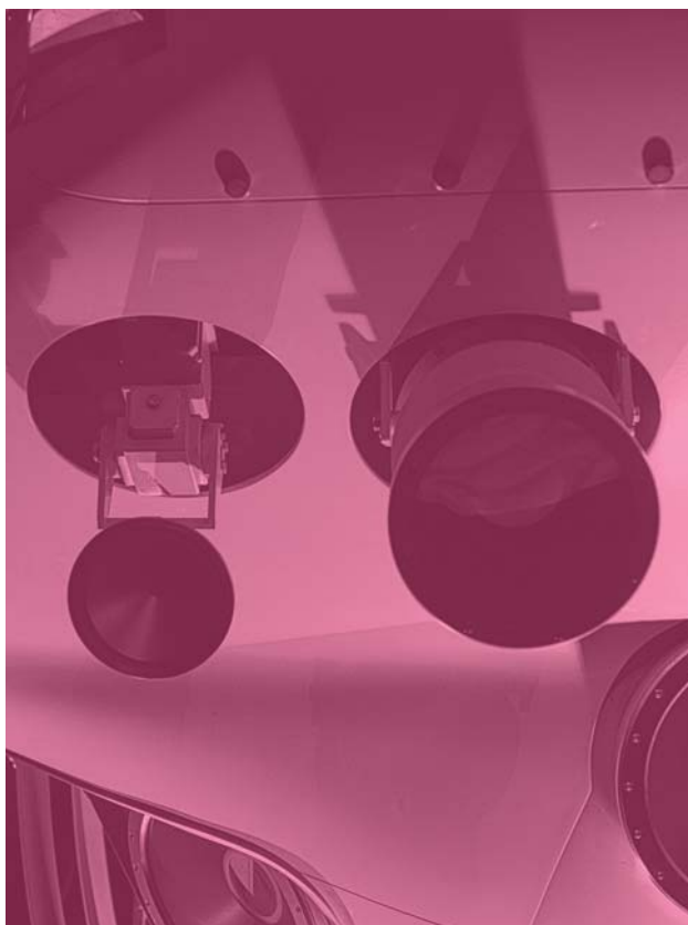
石川卓磨 | untitled #3 | 2013 | Chromogenic print | 431.8 × 355.6 mm

石川卓磨は写真作品を中心に作品発表を続けているアーティストです。彼は写真を絵画や映画などほかのメディアの中間の領域に位置するものであると考え、また、図版や資料写真、フォト・ロマンなど、文章に付随する写真の形式に注目しながら作品を作ってきました。『Filming Location:Invasion of the Body Snatchers』(2013年)では、ジャック・フィニの長編SF小説『盗まれた街』(1955年)を原作にしたドン・シーゲル監督の『ボディ・スナッチャー / 恐怖の街』(1956年)という何度もリメイクされている映画のリメイクを日本で行うという架空の撮影をもとにして行われたロケーション・ハンティング用の写真を作品化しました。この作品では、まわりの人間がつつぎと宇宙からきた未知の生命体に身体を乗っ取られ、別人になっていく原作のストーリーを、日本の風景のなかに置き換えて、見るという想像力を与えています。今回の展覧会では、映画『ミッション：インポッシブルシリーズ』の主人公であるイーサン・ハントを巡った作品『Ethan Hunt's Flashback』を発表します。