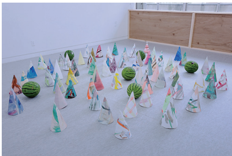
山本悠 | マイマイマイマイマイ | 2016 | 紙にアクリルほか | サイズ可変 | 撮影：新居上実