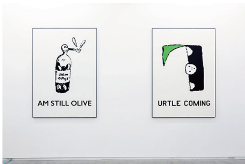
山本悠 | [左] I AM STILL OLIVE | 2017 | 紙にインクジェット | 145.6cm × 103cm [右] TURTLE COMING | 2017 | 紙にインクジェット | 145.6cm × 103cm | 撮影：木奥恵三