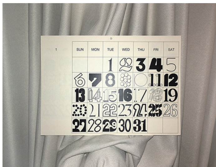
鈴木哲生 | カレンダー | 2019 | 2013年より制作・販売

主な展覧会に、「光るグラフィック展2」クリエイションギャラリーG8 (2019/東京)、「富士山展1.0」AWAJI Cafe & Gallery (2018/東京)、「TRANSBOOKS」book fair/TAM COWORKING TOKYO(2017/東京)、「会議」Earth & Salt (2016/東京)、「Exhibition Font Thesis」Галерея Промграфика (2015/モスクワ)、「大恐竜博」ホトリ (2015/東京)、「KABK Graduation Festival 2015」Royal Academy of Art The Hague (2015/ハーグ)、「Circle X 2」路地と人 (2014/東京)、「思いで」Earth & Salt (2014/東京)など。