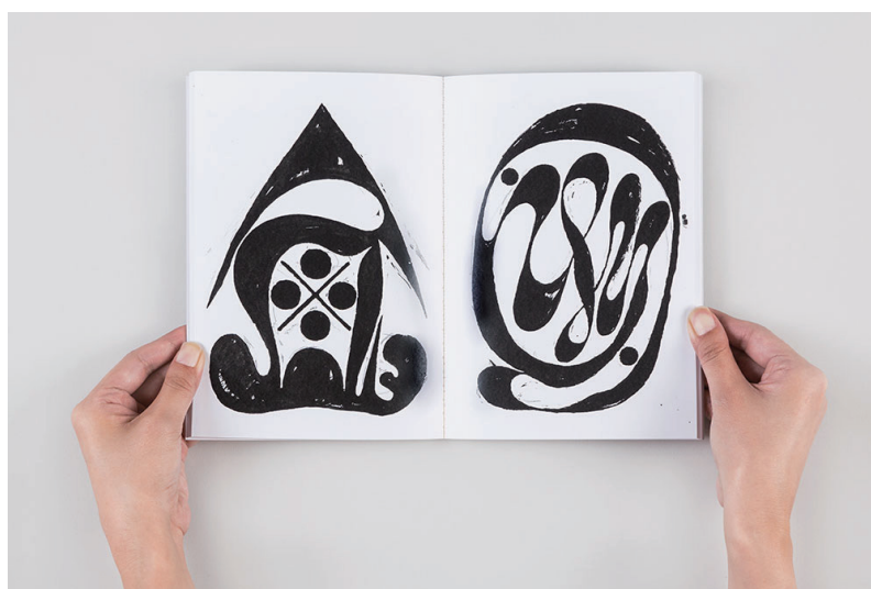
鈴木哲生 | 無題 | 2017 | アートブックフェア TRANS BOOKS 出展作品