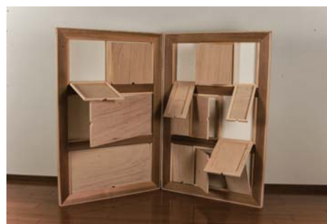
豊嶋康子 | 隠蔽工作 _20120622 | 2012 | 木、パネル、キャンバス | 742 x 518 x 50 mm