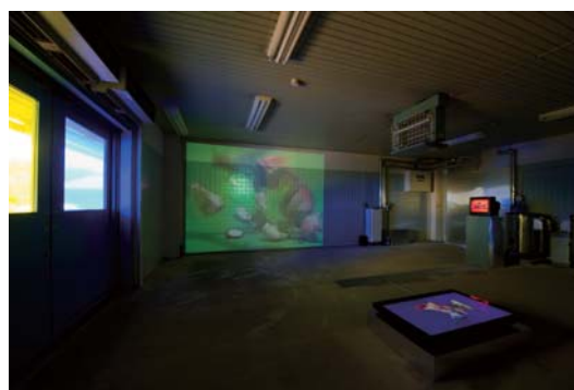
箕輪亜希子 | 鸚鵡の夢 | 2011 | DVD、プロジェクター、モニター、窓 | サイズ可変 | 撮影：加藤健