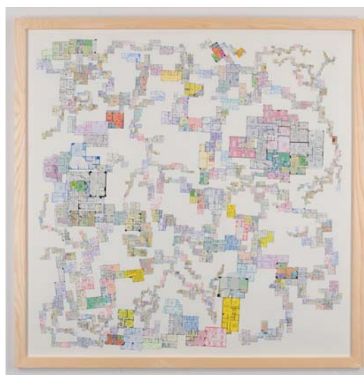
箕輪亜希子 | Floor plan | 2011 | 建売住宅広告紙 | 1300 x 1300 mm | 撮影：加藤健