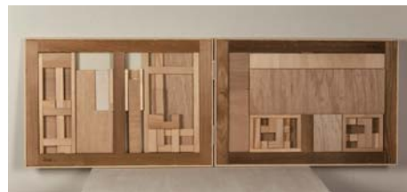
豊嶋康子 | 隠蔽工作 _20120630 | 2012 | 木、パネル、キャンバス | 424 x 620 x 46 mm