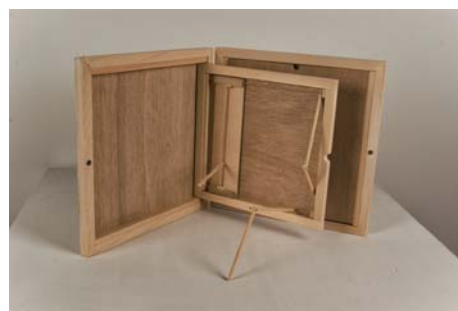
豊嶋康子 | 隠蔽工作 _20120515 | 2012 | 木、パネル、キャンバス | 296 x 295 x 36 mm