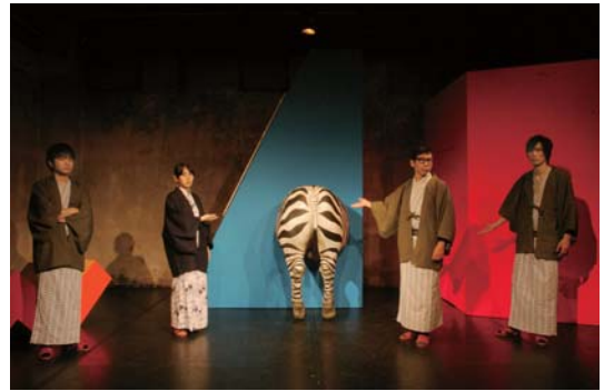
テニスコート | テニスコート第 10 回公演「防水と塗装」| 2011

2013 “一人称 2、0 (1、5 人称) (仮)” blanClass (神奈川) 2012 “O, 一、二人” blanClass (神奈川) “り・ぼん” 駒場アゴラサマーフィスティバル <汎-2012> (東京) 2010 “見テ。ニューボール” 川崎市アートセンター (神奈川) 2007 “テニスコートフォルト” リトルモア地下三回連続 (東京)