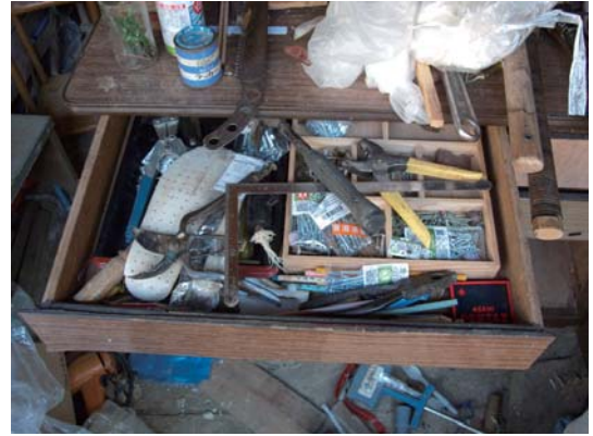
石川卓磨 | Public Assets | 2012 | Lambda print | 393 x 492 mm