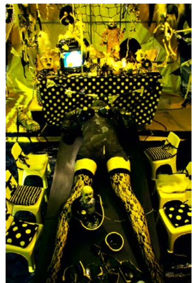
有賀慎吾 / Shingo Aruga Alternative Plant about15x15x10cm, rubbish(wrapping paper, package, shopping bag, etc.), 2011