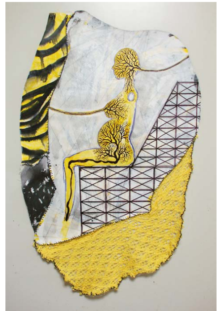
有賀慎吾 / Shingo Aruga cut and suture(Fragments of the Yellow Swamp) 67x42cm, mixed media, 2011

2009 "Dream of Cyborg"(Art Trace Gallery / Tokyo) "SETSUZOKU KAIJO"(Art Center Ongoing / Tokyo) "IKI -threshold-" (Sustainable Art Project,Ueno Town art Museum / Tokyo) "Sticky Sloppy Lumpy"(TURNER GALLERY / Tokyo) 2010 "5th Dimension" (Art Center Ongoing, NO MAN'S LAND, French Embassy / Tokyo) "Neo New Wave"(island / Chiba) "House"keep out"(Art Center Ongoing, KOGANECHO BAZAAR / Kanagawa) "Transformation in Large Plaster Cast Gallery" (Tokyo University of the Arts / Tokyo) 2011 "Power of a Painting"(3331 Arts Chiyoda / Tokyo) "Story of the Island"(Shodoshima island / Kagawa) "GOD HAND"(Art Line Kashiwa / Chiba) "TERATOTERA"(PARCO Kichijoji / Tokyo) "SLASH/05 -Syntactile-"(SPIRAL GARDEN / Tokyo) "The tale of the new famous place in Sumida River"(Tokyo) "THE COLOR OF FUTURE-The look to draw in-"(TURNER GALLERY / Tokyo) 2012 "BERMUDA TRIANGLE"(Château 2F / Tokyo)