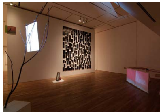
野沢裕 / Yutaka Nozawa Still Life with Landscape installation view, 2011

JEANS FACTORY ART AWARD 2008, Second prize