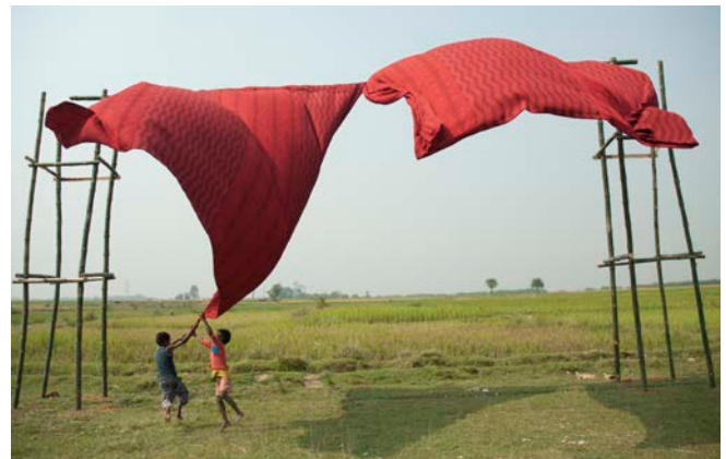
野沢裕 / Yutaka Nozawa Opening the Curtain installation view, 2011