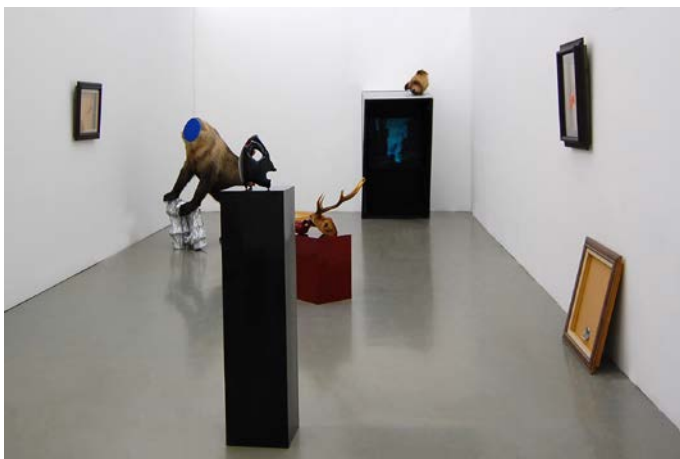
青木真莉子 / Mariko Aoki マザースペース resizable, mixed media, 2012