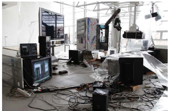
土居下太意 / Tai Doishita Pouringmouse Ver.0.1 resizable, mixed media, 2008