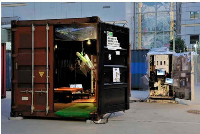
土居下太意 / Tai Doishita Pouringmouse KabukichoVer. mixed media, 2011